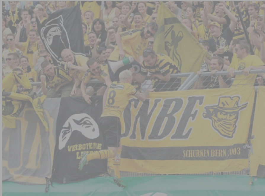
In Bern wollen Fanarbeiter mit diversen Projekten den Ruf der YB-Anhänger verbessern.